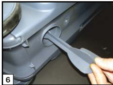
6 Graue Ventilbetätigung nach unten aus der Cassette ziehen