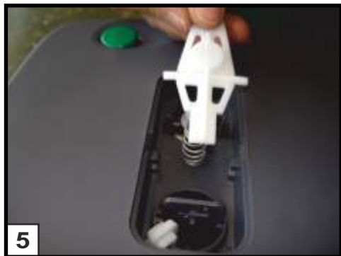
5 Ventilbetätigungsgestänge entnehmen