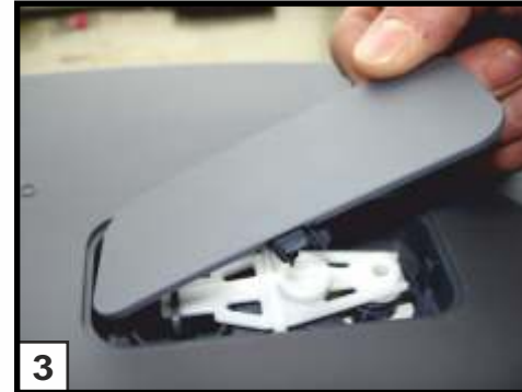
3 Abdeckplatte auf Cassette öffnen