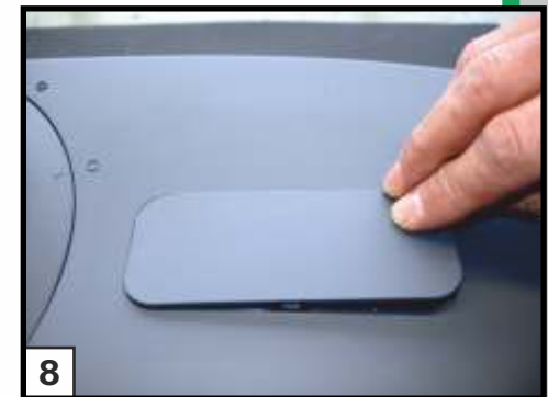
8 Schacht wieder mit Deckel verschließen