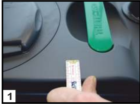
1 Bohrpunkt für Schlauchanschluss anzeichnen: von der Außenkante 30 mm nach innen anzeichnen