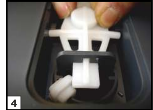
4 weiße Ventilbetätigungsgestänge aus der Lageraufnahme nach hinten schieben