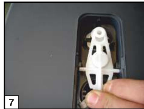
7 • weißes Ventilbetätigungsgestänge mit Feder wieder in die vorhandenen Fixierpunkte einsetzen • Ventil wird nun ständig geschlossen gehalten